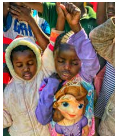
Mezi školáky je obrovský hlad po Bohu.