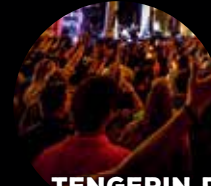
TENGERIN DOO WORSHIP