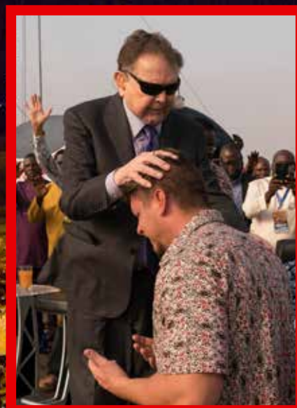
Modlitby se stovkami tisíc přímluvců

Prostřednictvím našich nových obřích LED obrazovek (sestavujících z celkem 456 modulů smontovaných dohromady) návštěvníci nejen slyší, ale i vidí, co se děje na pódiu. Každá z obrazovek je šest metrů vysoká a devět metrů široká. Tyto velkoplošné obrazovky zahájily zcela novou kapitolu v šíření evangelia v Africe.