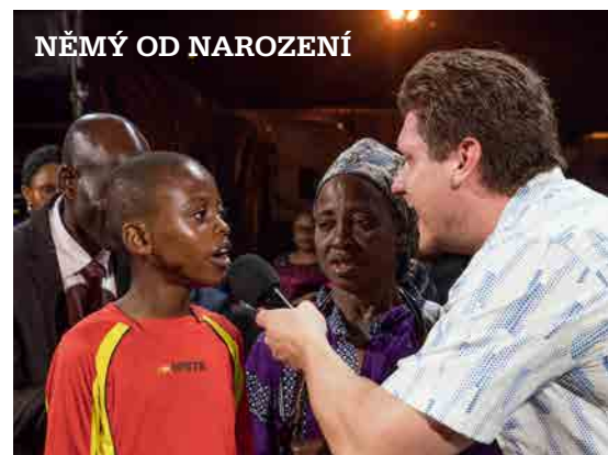
NĚMÝ OD NAROZENÍ