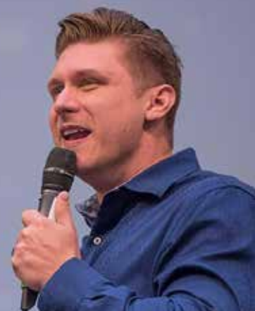
« Tunnel de prière »