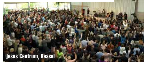
Jesus Centrum, Kassel