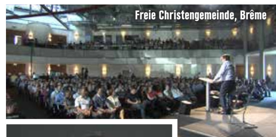
Freie Christengemeinde, Brême