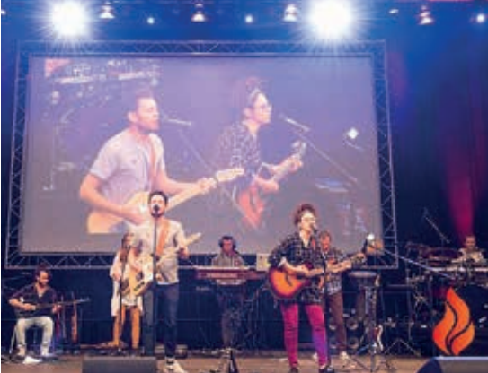
Band der „King of Kings“-Gemeinde aus Jerusalem