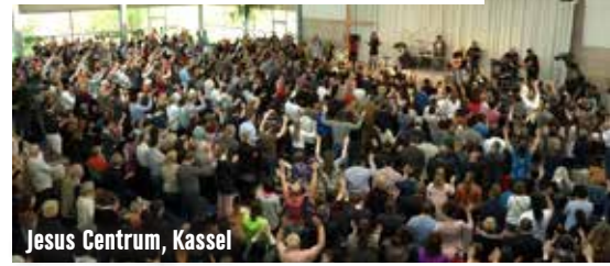
Jesus Centrum, Kassel