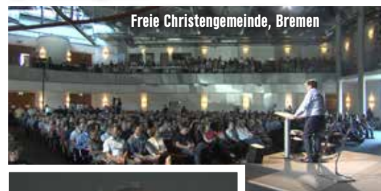
Freie Christengemeinde, Bremen