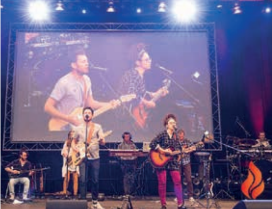
Worship band from "King of Kings" congregation in Jerusalem