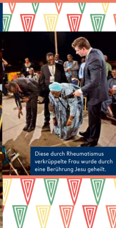
Diese durch Rheumatismus verkrüppelte Frau wurde durch eine Berührung Jesu geheilt.