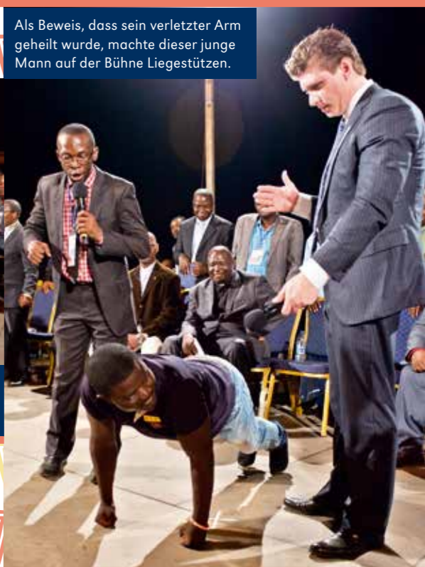
Als Beweis, dass sein verletzter Arm geheilt wurde, machte dieser junge Mann auf der Bühne Liegestützen.