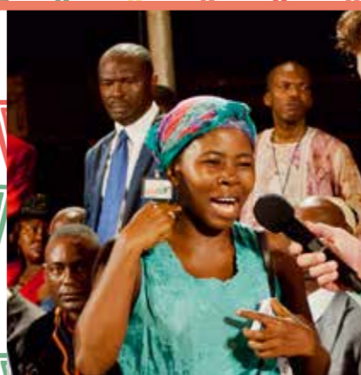
Eine ernsthafte Infektion im Mund – so schmerzhaft, dass sie kaum kauen konnte – bereiteten dieser Frau große Probleme. Doch plötzlich empfand sie, wie die Kraft Gottes über sie kam. Seitdem sind alle Schmerzen verschwunden. Zum Beweis schlug sie sich auf ihre Wangen.