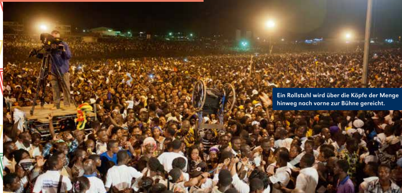
Ein Rollstuhl wird über die Köpfe der Menge hinweg nach vorne zur Bühne gereicht.