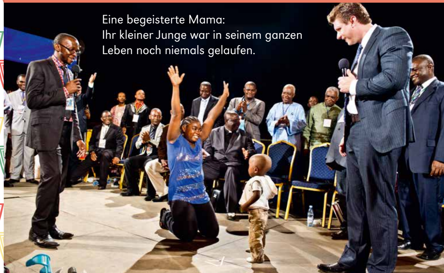
Eine begeisterte Mama: Ihr kleiner Junge war in seinem ganzen Leben noch niemals gelaufen.