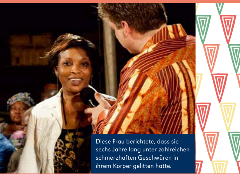
Diese Frau berichtete, dass sie sechs Jahre lang unter zahlreichen schmerzhaften Geschwüren in ihrem Körper gelitten hatte.