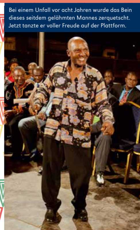
Bei einem Unfall vor acht Jahren wurde das Bein dieses seitdem gelähmten Mannes zerquetscht. Jetzt tanzte er voller Freude auf der Plattform.