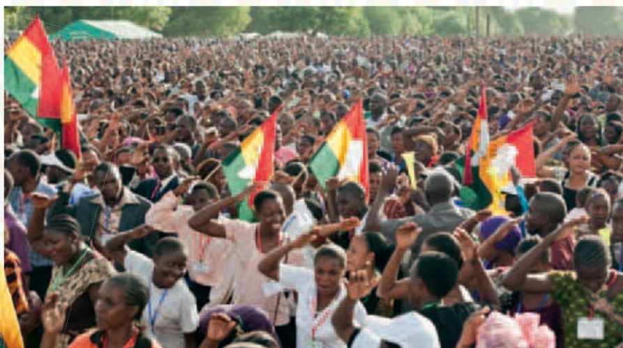
Aktivně zapojení: Přímluvci z různých církví se modlí přímo uprostřed shromážděných zástupů lidí.