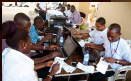
Efektivní následná péče o nově obrácené: karty rozhodnutí z Akkry byly okamžitě zpracovány počítačem a více než dvacet tisíc lidí dostalo jen o hodinu později první sms zprávu.

jen okrajově, Duch Svatý vždy rád dotvrzuje Ježíšovo Pánství prostřednictvím znamení a divů. Kristus pro všechny národy chce i nadále vyhlášovat evangelium způsobem, který popisuje Pavel v 1. Korintským 2:4-5: „ Mé poselství a kázání nespočívalo v přesvědčivých argumentech lidské moudrosti, ale v prokázání Ducha a Jeho moci , neboť jsem nechtěl, aby se vaše víra zakládala na lidské moudrosti, ale na Boží moci. “